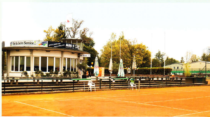
Der Karlsruher Eislauf- und Tennisverein 1911 e.V. bietet neben Außenplätzen auch eine Tennishalle für das wetterunabhängige Training.

Autor: Bernhard Jilke, Projektberater Projektteam Energieoptimierung, Regiolux